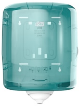
Tork Reflex Einzelblatt Inrospender 473180