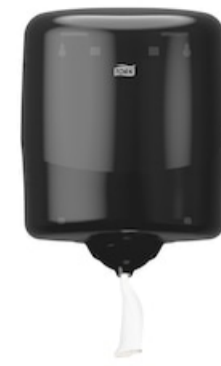
Tork Reflex Einzelbl.Innenabr.M4 schwarz 473191