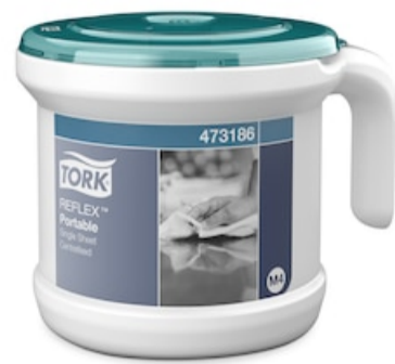
Tork Reflex Portab Cf Start Pack Turq 473186