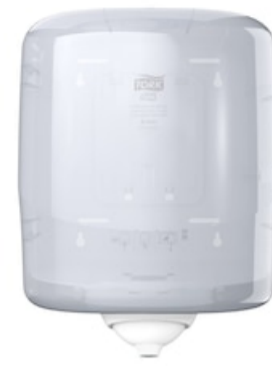
Tork Reflex Sing Sh Cf disp White 473190