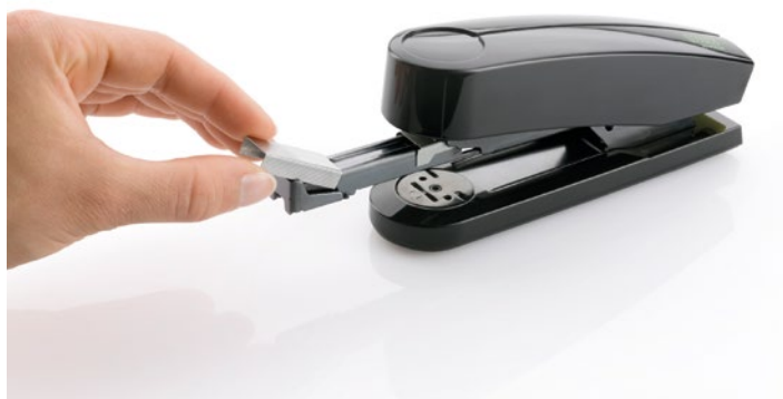
Mit der Springfachlademechanik wird das Beladen eine Leichtigkeit. Auf Knopfdruck an der Geräterückseite springt der Klammerkanal automatisch zum Beladen nach vorne.