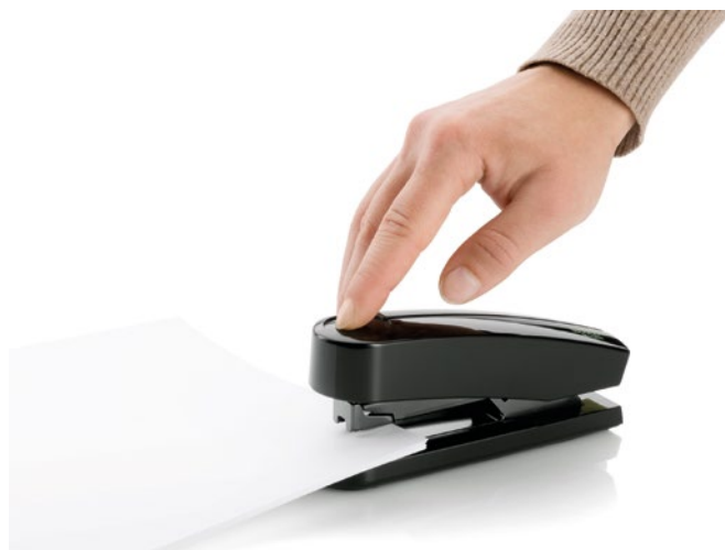
Schnell und einfach Heften mit den Novus Heftgeräten.