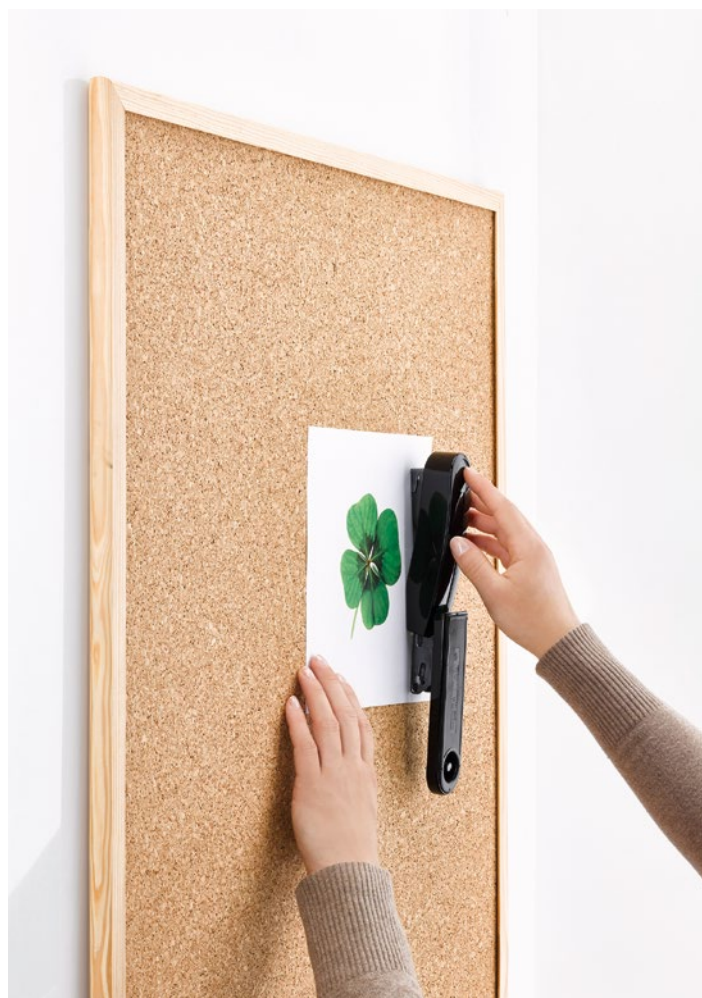
Die mögliche Heftart: Nageln