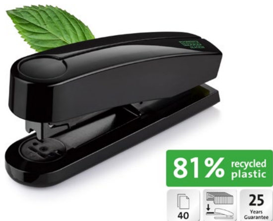
Novus B 4 re+new mit Piktogrammen