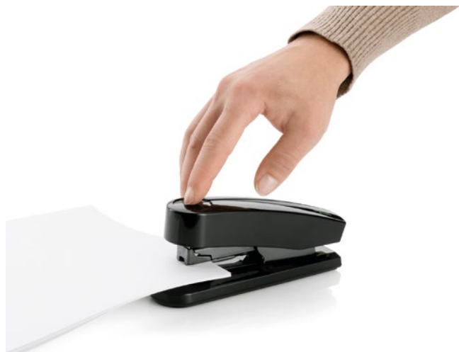
Schnell und einfach Heften mit den Novus Heftgeräten.