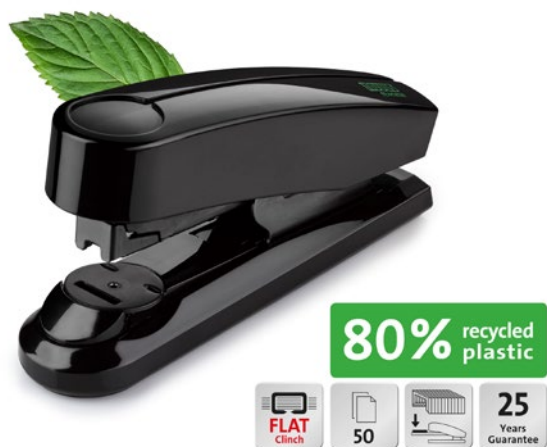
Novus B 4 FC re+new mit Piktogrammen