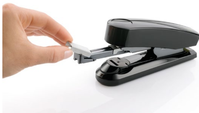
Auf Knopfdruck an der Geräterückseite springt der Klammerkanal automatisch zum Beladen nach vorne.