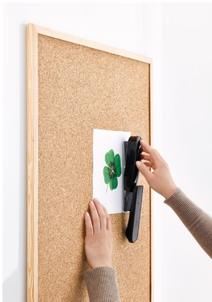
Die mögliche Heftart: Nageln